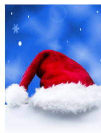
Safran Drogerie Weihnachtsmann

Was riecht denn da so herrlich fein? Es muss der Winterzauber sein! Ätherische Öle tun uns gut, wärmen unser Herz und machen Mut. Verzaubern Sie Ihre Wohnräume mit feinem Duft, dann liegt die gute Atmosphäre bereits in der Luft!