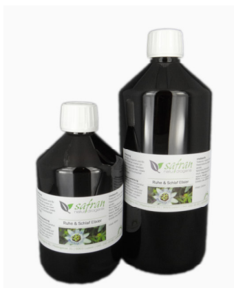
Ruhe & Schlaf Elixier 500ml Fr. 24.50 1000ml Fr. 42.50