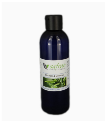
Muskeln & Gelenke Crèmeölbäd 200 ml Fr. 25.50

Gerne veröffentlichen wir auch Ihren Erfolg mit unseren Produkten.