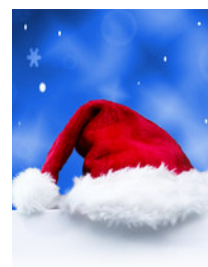
Safran Drogerie Weihnachtsmann

Das Arvenkissen mit Fellrückseite ist besonders beliebt zum Kuseln für Kinder. Kissen 20x20cm Fr. 24.50 Für einen entspannten Schlaf auch für Erwachsene. Arvenkissen weiss mit Arvenspray 40x60cm Fr. 129.00