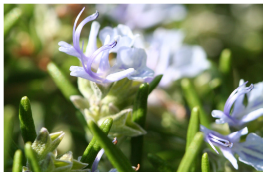
Rosmarin Rosmarinus officinalis