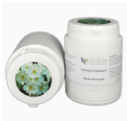
Cardio Komplex Kapseln 200 Stück Fr. 49.00

Gerne veröffentlichen wir auch Ihren Erfolg mit unseren Produkten.