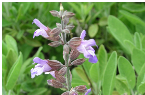
Salbei Salvia officinalis