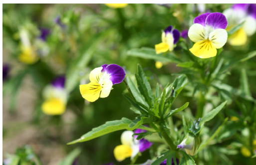
Wildes Stiefmütterchen Viola tricoloris