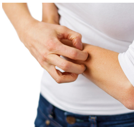
Ekzem Salbe 50g Fr. 32.50 Ekzem Emulsion 125ml Fr. 32.50