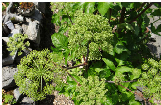
Engelwurz Angelica