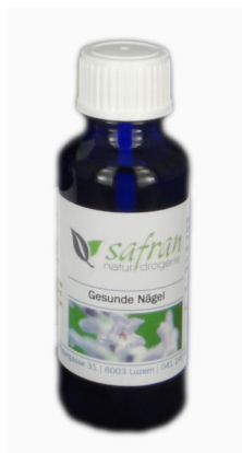
Gesunde Nägel Öl 30ml Fr. 29.80

Vielen Dank, wir freuen uns immer wieder auf tolle Rückmeldungen von Ihnen und berichten an dieser Stelle sehr gerne davon.