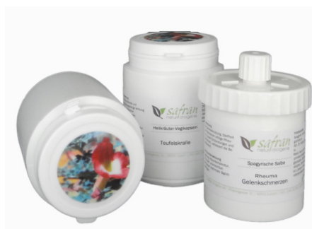
Teufelskralle Kapseln 200 Stück Fr. 39.00 Spagyrische Rheuma Salbe 100g Fr. 29.80

Aktionsangebot: 200 Stück Teufelskralle Kapseln und 100g Rheumasalbe erhalten Sie jetzt für Fr. 59.00 statt Fr. 68.80, solange der Vorrat reicht.