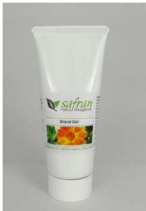
Brand-Gel 100g Fr. 24.80

Gerne veröffentlichen wir auch Ihren Erfolg mit unseren Produkten.