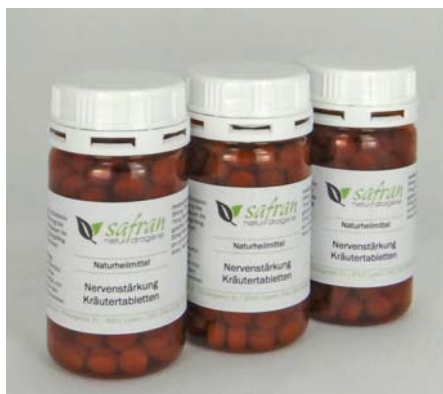
Nervenstärkungstabletten 180 Stück Fr. 49.00