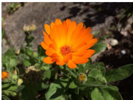
Ringelblume Calendula