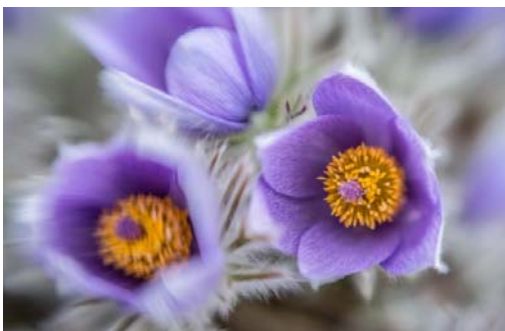
Kuhschelle Pulsatilla pratensis

Foto: Priska Trautwein Blütenblatt Luzern