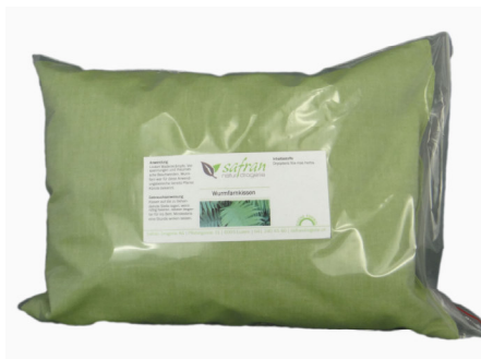
Farnkissen Fr. 34.50

Informieren Sie uns persönlich, per Email oder Telefon. Wir freuen uns!