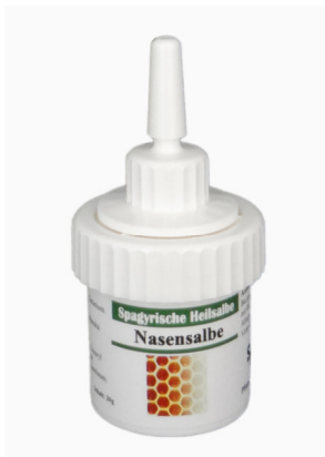
Spagyrische Nasensalbe 20g Fr. 10.80

Die Nasensalbe ist natürlich und enthält spagyrische Essenzen von Katzenkraut, Propolis und Geranium. Zusätzlich enthält sie folgende ätherische Öle: Lavendel, Palmarosa und Manuka. Diese wirken beruhigend, schleimhautregenerierend und antibakteriell und antiviral.