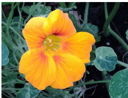
Kapuzinerkresse Tropaeolum majus