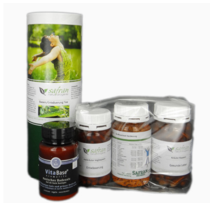
Entschlackung Set für 2 Wochen mit 5 Produkten Fr. 95.00