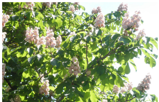
Rosskastanie Aesculus Hippocastanum