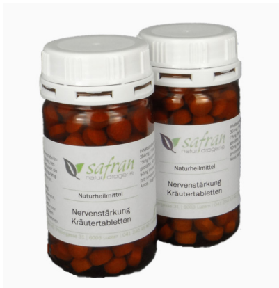
Nervenstärkungs Tabletten 180 Stück Fr. 49.00

Gerne veröffentlichen wir auch Ihren Erfolg mit unseren Produkten.